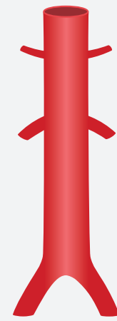
وعاء دموي صحيح