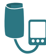
ضغط الدم المرتفع