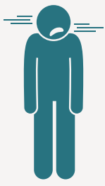
الفيروس المخلوي التنفسي (RSV)