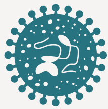
التهاب الكبد B