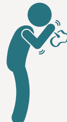
الدفترية، والتيتانوس، والسعال الديكي (الشاهوق)